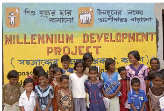
Im Millenniumsdorf Gandhiji Songha (Indien) leistet die Welthungerhilfe einen Beitrag zur lokalen Erreichung der MDGs.

Die Wirkung der MDGs auf nationaler Ebene wird dadurch eingeschränkt, dass wichtige politische Stellschrauben wie gute